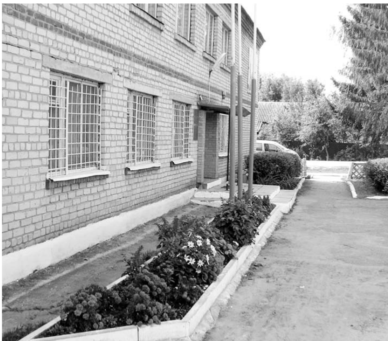
Перед зданием военкомата заасфальтированный пятачок, который, тем не менее, сотрудники военкомата смогли в этом году прекрасно оформить и содержать в идеальном состоянии.