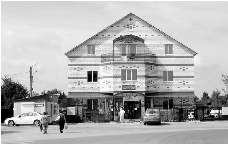
Всегда поддерживается чистота и порядок перед магазином «Сантехника».

бы в отдельно взятом доме старшего по дому, там намечались заметные изменения. Некоторые из старших еще весной пришли ко мне за помощью в благоустройстве придомовой территории, и всем, кто к